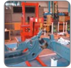
Saatavissa kallistuslaitteella ja/ tai muilla lisävarusteilla, kuten nostovarrella, tynnyrin kallistuslaitteella, kauko-ohjaimella, automaattisella korkeudensäädöllä, sisäänrakennetulla laturilla jne.