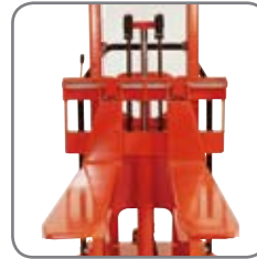
Säädettäviä haarukoita on saatavissa lisävarusteena. Useat pituudet ja rakenteet.