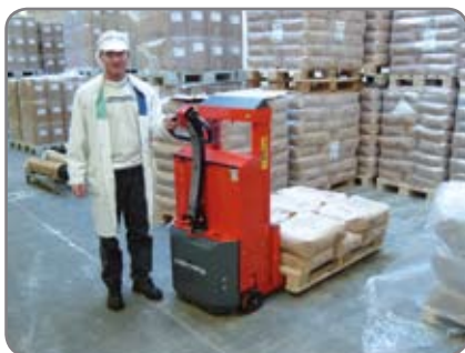
Optimaalista turvallisuutta läpinäkyvällä ja iskunkestävällä turvalasilla. Alennettu ajonopeus kun haarukakorkeus yli 500 mm.