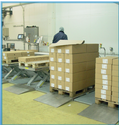
Matalarakenteinen nostopöytä osana pakkauslinjaa.

Vakiopöydän sähkösyöttö on 3x400 V / 50 Hz. Ohjauskeskuksen ja painikeohjaimen suojausluokka on IP65 ja koko pöydän suojausluokka on IP54.