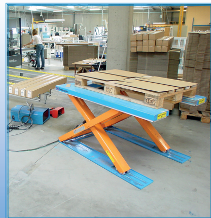
Vaihtoehdot: maalattuna RAL-sävyyn, ruostumaton tai galvanoitu teräs.