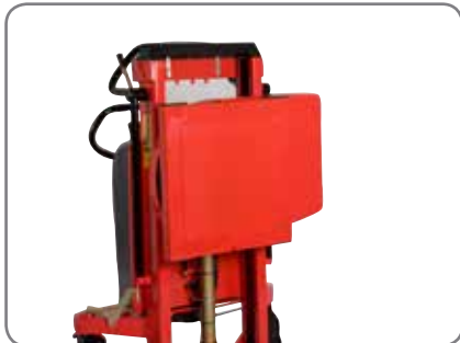
Asennuskonsoli, johon voidaan asentaa esim. asiakkaan omia työkaluja.

Laatikonpitimien käyttöä suositellaan, mikäli taakkaa kallistetaan yli 60°.