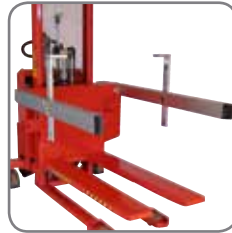
Lisävarusteena saatavana yksi tai kaksi sarjaa sivutukia sekä laatikonpitimet.