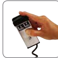
Kääntöä ohjataan kaukoohjaimella. (vakiona langallinen; saatavissa myös langattomana) Kauko-ohjaus saatavissa myös nostori/ laskun ohjaukseen.