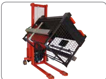
Rotator voi kääntää laatikon 180°, kun sivutuet varustettu laatikonpitimillä.