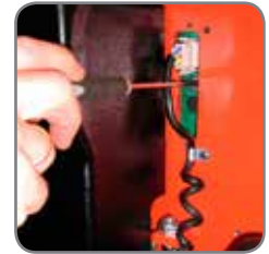
Kääntökulman ja –nopeuden helppo säätö.