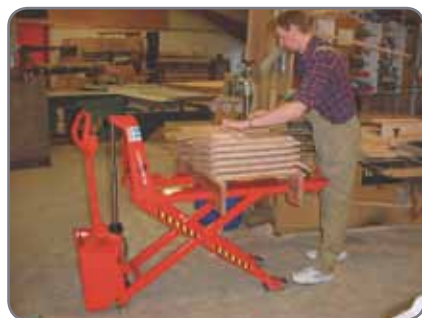
Lisävarusteina: kauko-ohjaus, automaattinen tasonsäätö, jarru, erillinen taikka sisäänrakennettu laturi.