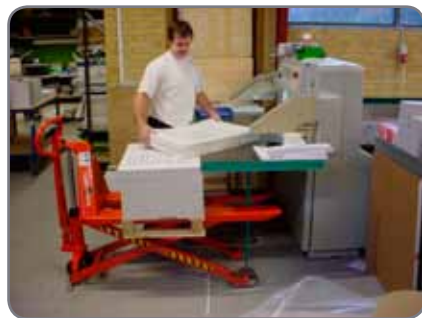
HL 1006 ominaisuuksia ovat pieni voiman tarve, varvassuojat sekä käyttökahvan vapaa-asento.