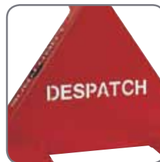
Mahdollisuus merkitä vaunu nimellä/ osastolla.