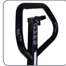
Ergonominen kahva takaa käyttäjälle rennon otteen.