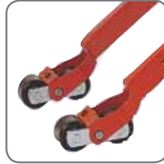
Telipyörillä on jarrutoiminto. Pyörämateriaalit ovat lattiaystävällisiä.