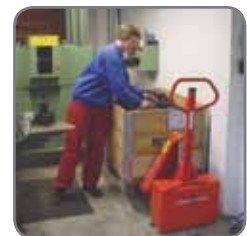
Patentoitu sylinterirakenne mahdollistaa matalan rakennekorkeuden.