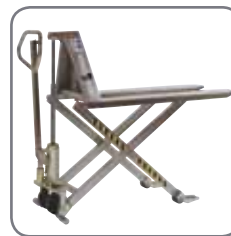
Saatavissa käsi- tai akkukäyttöisenä, ruostumattomana taikka Ex-suojattuna.