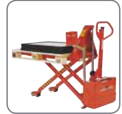
Automaattinen korkeuden-säätölaitte (lisävaruste) varmistaa ihanteellisen työskentelykorkeuden.