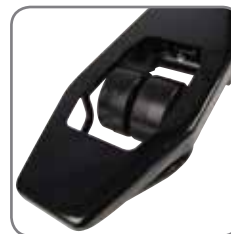
Rinnakkain asennetut haarukkapyörät takaavat hyvät kääntöominaisuudet.