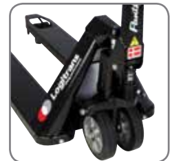
Panther Silentissa on pikanosto vakiona.