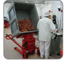
Täydellinen työskentelyasento laatikon tai lavan tyhjennykseen – seisten tai istuen.