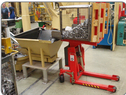
Logitilt käytössä komponentiteollisuudessa.