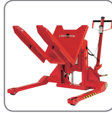
Logitilt leveillä tukijaloilla mahdollistaa erilaisten lavatyypin, kuten suljettujen lavojen käsittelyn.