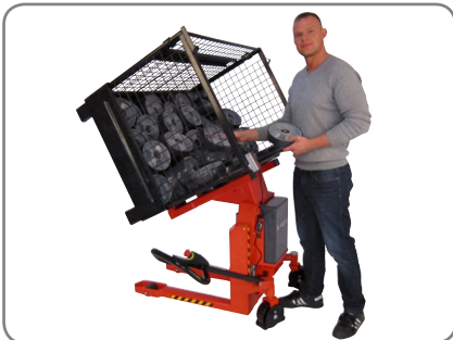
Käyttökahva voidaan kääntää sivuun, jotta käyttäjä yletty esteettä laatikon tai lavan sisältöön.

Vahva rakenne varmistaa pitkän käyttöiän ja alhaiset huoltokustannukset.